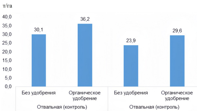
Рисунок 2 - Влияние основной обработки почвы и органического удобрения на урожайность зеленой массы кукурузы за 2022–2024 гг.

Урожайность зеленой массы кукурузы в среднем за годы исследований на контроле достигала 30,1 т/га (рис. 2), внесение органического удобрения способствовало повышению урожайности зеленой массы на 20% (6,1 т/га) при НСР=1,84 . На варианте с безотвальным рыхлением без применения удобрения выход зеленой массы кукурузы был достоверно ниже — 23,9 т/га, что более чем на 21% (6,2 т/га) ниже чем на контроле. Применение органического удобрения под безотвальное рыхление приводило к увеличению продуктивности относительно варианта без применения удобрения на 5,7 т/га, что на 24% больше. Однако относительно контроля достоверных отклонений не наблюдалось. При этом относительно удобренного отвального варианта значения были ниже на 6,6 т/га. Это может свидетельствовать том, что неполная заделка органических удобрений в почву приводит к значительному снижению их эффективности.